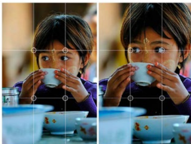
Image cadrée sans et avec règle des tiers