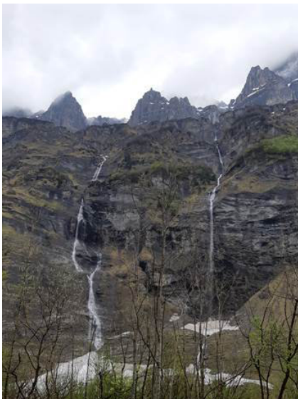
Le Bout du Monde

Pour le classement final, un petit quiz culturel sur la région fut organisé. Le tout s'est déroulé dans la bonne humeur et avec le beau temps !