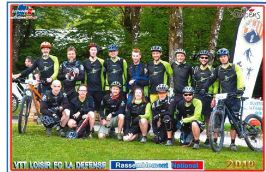
La section VTT du Celar Sports

L'équipe du CELAR-SPORTS (au nombre de 15 VTTistes) s'est d'ailleurs échauffée autour de Samoëns pendant 2 jours, juste avant le rassemblement. Ceci nous a donné l'occasion de bien s'acclimater à la région et même de pouvoir rouler dans la neige !